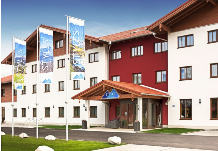
Das STYLES Hotel Piding in der Außenansicht.

TROX ist führend in der Entwicklung, der Herstellung und dem Vertrieb von Komponenten, Geräten und Systemen zur Belüftung und Klimatisierung von Räumen. Mit 27 Tochtergesellschaften in 27 Ländern auf fünf Kontinenten, 14 Produktionsstätten und weiteren Importeuren und Vertretungen ist das Unternehmen in über 70 Ländern vor Ort. Gegründet 1951, hat der Weltmarktführer mit Stammhaus in Deutschland im Jahre 2016 mit 3.770 Mitarbeitern rund um den Globus einen Umsatz von annähernd 500 Mio. Euro erzielt.