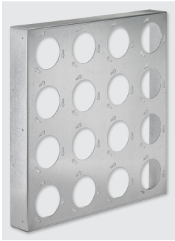
Montageplaat, type MP