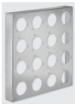
Montageplaat, type MP