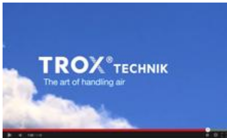
TROX - l'air, c'est la vie

Venez nous retrouver sur YouTube et notre chaine TROX France