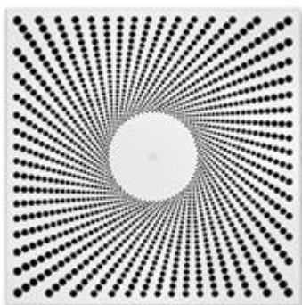
Diffuseur design XARTO