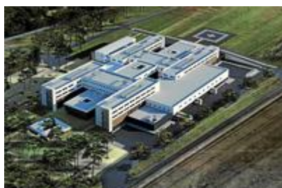
© Copyright : Pôle de Santé d'Arcachon élaboré par le cabinet d'architectes Groupe 6